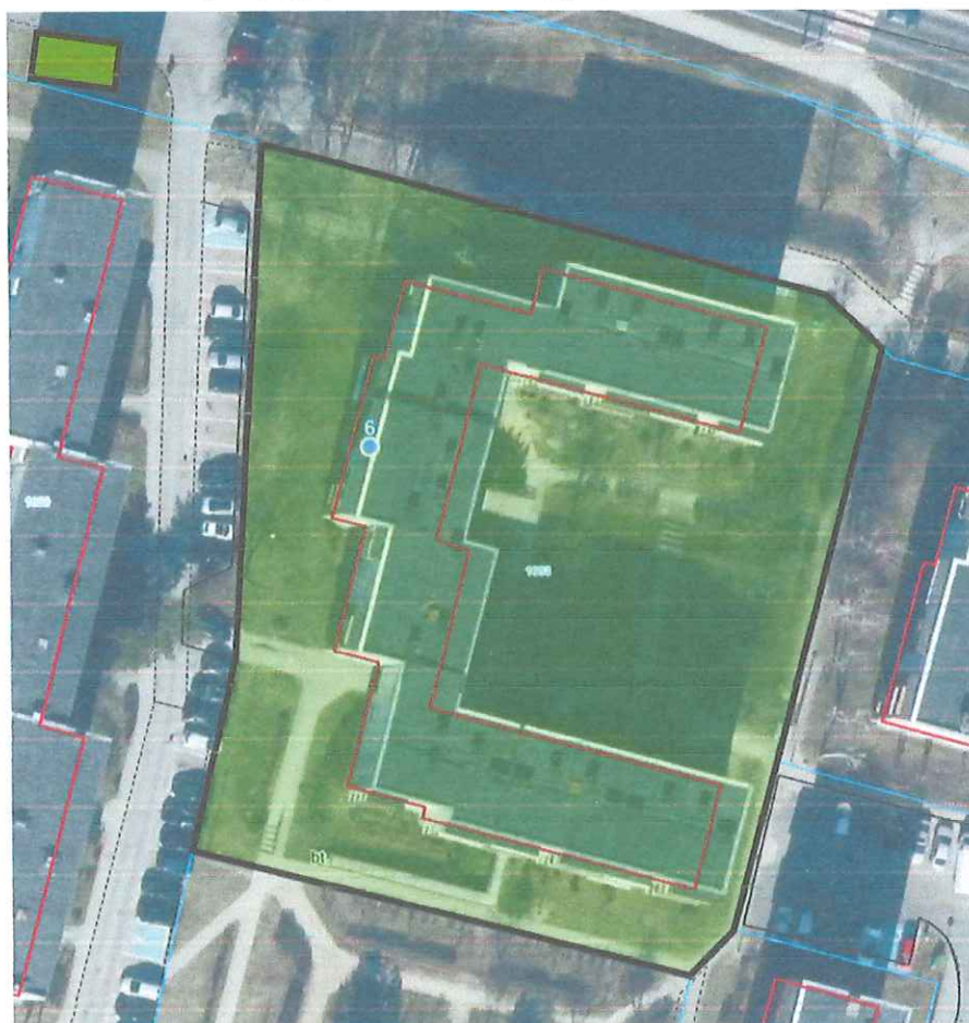
Mapka poglądowa obszaru objętego zamówieniem